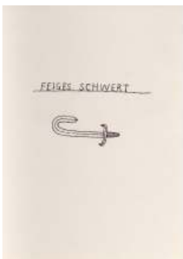
Beni Bischof. Feiges Schwert, 2008, Privatbesitz

Ausstellungsstücke: 80 Gemälde, Zeichnungen, Skulpturen und Installationen