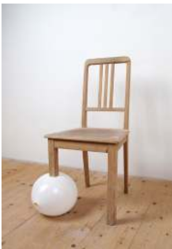
Roman Signer. Stuhl mit Ballon, 2009, Privatbesitz

In Next Generation – Einblicke in junge Ostschweizer Privatsammlungen öffnet sich das Kunstmuseum der jüngsten Generation von Sammlerinnen und Sammlern. Die Ausstellung ermöglicht einen ersten Einblick in mehrere mit grosser Neugierde, mit viel Engagement, Umsicht und Sachkenntnis zusammengetragene Kollektionen, deren Spektrum von regionaler zu internationaler Kunst, von etablierten zu noch