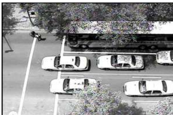
Robert Barry. Now and then, 2002 (Still), Privatbesitz