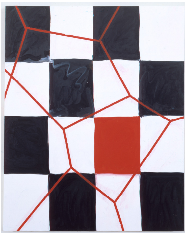
Mary Heilmann. Crack Up, 1998 Ursula Hauser Collection, Switzerland

Kunstmuseum St.Gallen Museumstrasse 32 CH-9000 St.Gallen