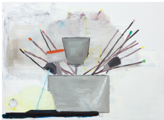
Matthias Zinn. Pinsel, 2008

Privatbesitz, Courtesy Mai 36 Galerie, Zürich