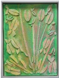
Andreas Slominski, xSBy28z , 2008, Courtesy der Künstler

Ab 10. Juli werden die Werke des deutschen Malers und Objektkünstlers Andreas Slominski im Kunstmuseum zu sehen sein. Auch er interpretiert traditionelles Kunstschaffen wie Malerei und Reliefs neu. Sein spielerischer Umgang zeigt sich in der Materialität – feiner Marmor wird durch billiges Styropor ersetzt – und den thematischen Schwerpunkten: traditionelle historische und religiöse Themen weichen zuckersüssen, kitschigen Motiven.