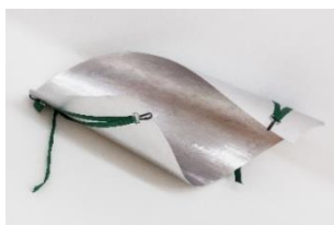
Marie Lund, The Apartment , 2020

Die dänische Künstlerin Marie Lund verfolgt in ihrem Werk bildhauerische Fragestellungen und betreibt einen vielschichtigen Umgang mit dem Medium der Skulptur. Ab dem 8. Mai werden im Kunstmuseum St.Gallen neue plastischen Arbeiten zu sehen sein, die sich auf die prägnanten architektonischen Elemente des Museums beziehen und bis in den Aussenraum ausgreifen.