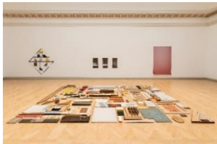
Heimspiel 2018, Ausstellungsansicht, Kunstmuseum St.Gallen

Ende 2021 bietet das Heimspiel erneut eine repräsentative Plattform für zeitgenössisches Kunstschaffen in der Region der Ostschweiz, des angrenzenden Vorarlbergs und des Fürstentums Liechtenstein. Neben dem Kunstmuseum St.Gallen, der Kunst Halle Sankt Gallen, der Kunsthalle Appenzell und dem Kunstraum Dornbirn finden die Ausstellungen 2021 neu auch im Kunsthaus Glarus statt. Die Ausstellungskooperation soll zu Begegnungen, Vernetzung, Kommunikation und länderübergreifendem Austausch über bildende Kunst führen.