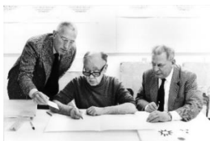
Jürg Janett – Eugène Ionesco – Franz Larese, 1983

Die Ausstellung Blicke aus der Zeit (ab 27. März) bringt Werke aus der Sammlung epochenübergreifend in neue Konstellationen, lässt Augen schweifen und Blicke sich treffen – aus den Bildern heraus und in die Bilder hinein. Dazu versteht sich die Ausstellung Einblicke – Ausblicke (ab 23. Oktober) als komplementäres Gegenstück, die auf das menschliche Gesicht sowie das Auge fokussiert und auf das, was dieses erblickt.