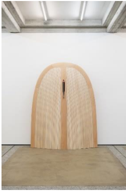
Camille Blatrix (*1984, Paris) Fra Francesca , 2019 Tulpenbaum- und Lindenbaumholz, graue Abdichtung, Acrylharz, Edelstahl, Gummi 250 x 200 x 30 cm Courtesy der Künstler und Galerie Balice Hertling, Paris; Andrew Kreps, New York