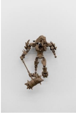
Yngve Holen (*1979, Braunschweig) Unhide The Zero , 2019 Bronze 43 × 30 × 15.5 cm