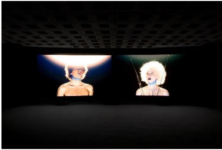
Rà di Martino (*1975, Rom) Afterall (a space mambo) , 2019 Video, 12:30 min