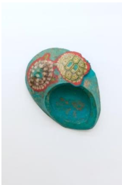
Diego Perrone (*1970, Asti) Ohne Titel , 2018 Wachs und Metall 115 x 120 x 42 cm Courtesy der Künstler und Galleria Massimo De Carlo, Mailand, London, Hong Kong