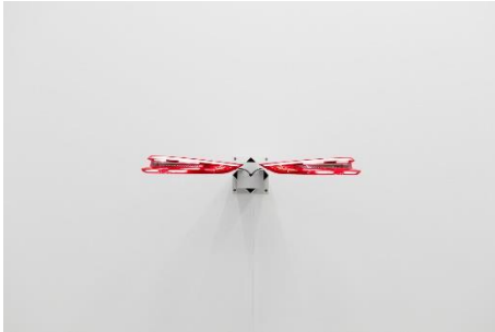
Yngve Holen (*1979, Braunschweig) Hater Taillight , 2016 Schlusslicht, pulverbeschichteter Stahl 28 x 105 x 90 cm Courtesy der Künstler und Galerie Neu, Berlin; MODERN ART, London; Neue Alte Brücke, Frankfurt