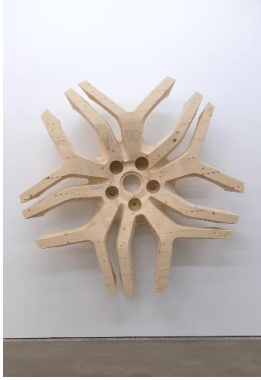
Yngve Holen (*1979, Braunschweig) Rose Painting , 2018 Sperrholz (CLT) Ø 200 cm, T 30 cm Courtesy der Künstler und Galerie Neu, Berlin; MODERN ART, London; Neue Alte Brücke, Frankfurt