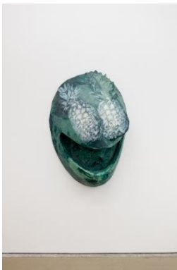
Diego Perrone (*1970, Asti) Ohne Titel , 2018 Wachs und Metall 130 x 90 x 31 cm