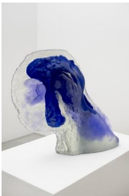
Diego Perrone (*1970, Asti) La notte all'indietro pesa , 2019 Wachsausschmelzguss von Glaspaste 90 x 95 x 15,5 cm Sockel aus MDF, weiss lackiert 120 x 60 x 90 cm H Courtesy der Künstler und Galleria Massimo De Carlo, Mailand, London, Hong Kong