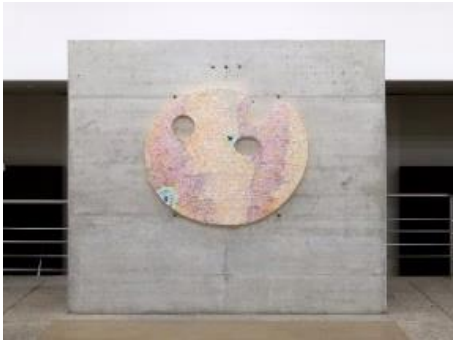
Guan Xiao (*1983, Peking) Puddle, Moon, Shoelace , 2020 Holzplatte, Poly-Kitt-Basis, Acrylfarbe 140 x 118 x 7.5 cm Courtesy die Künstlerin und Kraupa-Tuskany Zeidler, Berlin; Antenna Space, Shanghai