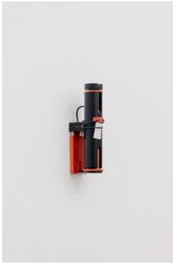
Camille Blatrix (*1984, Paris) Sang , 2017 Harz, Papier, Gummi, Edelstahl 19.5 x 8 x 4.5 cm