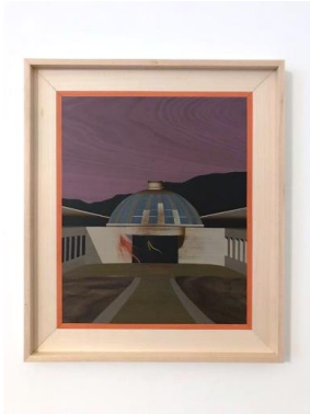
Camille Blatrix (*1984, Paris) Weiterbildungszentrum Holzweid , 2020 Birnbäum, Intarsie aus Holz 30 x 35 cm Courtesy der Künstler und Galerie Balice Hertling, Paris; Andrew Kreps, New York