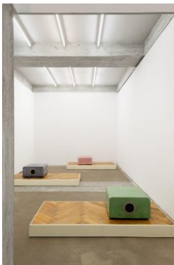
Timotheé Calame (*1991, Genf) Mobilier/Documentaire - Pupuces (Elegie) Mobilier/Documentaire - GenferGuru Mobilier/Documentaire - Masculine Hard Soles & Kibbutzniks Junior 2020 Holz, pigmentierter Beton, Abfluss, Räder, Acryl auf mdf, Stahl, Lautsprecher, Ton je 205 x 94 x 50 cm